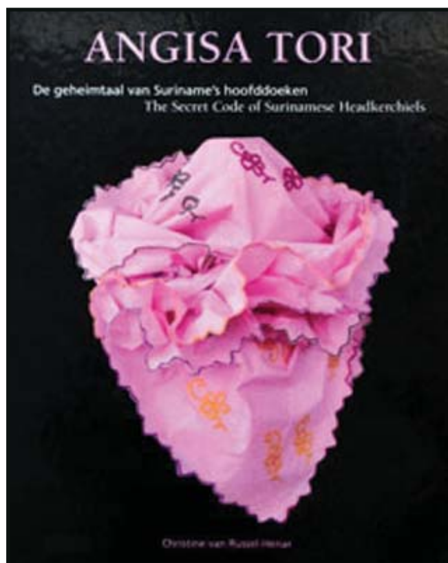
Voorkaft van het boek Angisa Tori