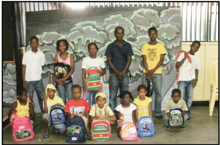
Enkele kinderen die een schoolpakket hebben ontvangen

Voor de uitdeling van de pakketten is er een speciale dag georganiseerd bij het NAKS Centrum onder genot van een hapje en een drankje. “Als je de uitbundige blijde reacties van de ouders hoorde, zou je je bijna afvragen wie er eigenlijk de pakketten kregen”, vertelt