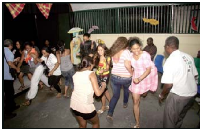
Ook gezellig meedoen aan de Kangaspelletjes ontbrak niet