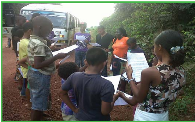
Dag 3 Zondag 25 november 2012