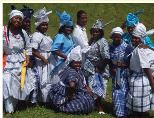
Jongeren van NAKS Wan Rutu en Ala Firi

Wanneer de hele evaluatie is afgerond, zal er een kennismakingsdag georganiseerd worden om nieuwe leden in de groep op te nemen. Het plan is om de nieuwe leden eerst te screenen, een gesprek met ze te hebben, het liefst met een hoofdbestuurslid erbij. Daarna krijgen ze twee maanden de gelegenheid om te bewijzen dat ze gekwalificeerd zijn voor datgene waarvoor ze zich inschrijven. Hierna worden ze geëvalueerd en dan eindelijk betiteld als lid van NAKS Wan Rutu of NAKS Ala Firi.