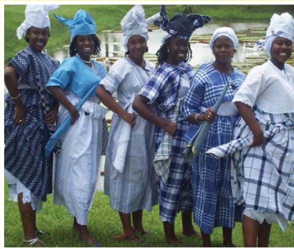
Jongeren van NAKS Wan Rutu en Ala Firi

Al vanaf december krijgen de NAKS afdelingen Wan Rutu en Ala Firi vele verzoeken van jongeren die lid willen worden. De bestuursleden van deze afdelingen vinden dat ze eerst intern moeten evalueren alvorens nieuwe mensen toe te laten. De evaluatie is begonnen met het individueel evalueren van de leden. Hierbij worden enkele vragen gesteld zoals: