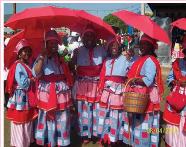
Enkele leden van NAKS tijdens AVD in het jaar 2010