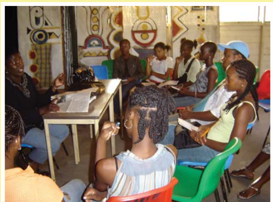
NAKS jongeren tijdens educatiesessie

Om dit allemaal professioneel en kwalitatief beter uit te werken is een professioneel bureau - RFF Consultancy - benaderd. Dit bureau zal in samenwerking met de NAKS-ers nagaan wat voor trainingen precies nodig zijn en een trainingsprogramma uitwerken. In april zal het bureau interviews afnemen van individuen, groepen en afdelingen en observeren hoe wij tewerk gaan bij het uitvoeren van activiteiten.