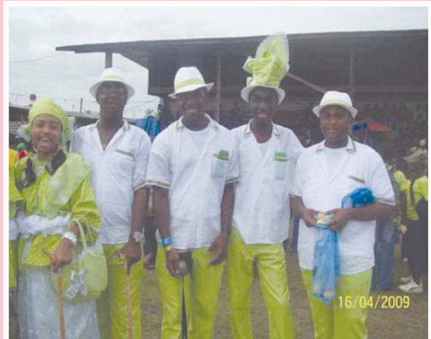
Enkele leden van NAKS tijdens AVD in het jaar 2009

De inschrijving is afgesloten. De NAKS groep bestaat dit jaar uit 40 personen: 29 dames en 11 heren. "En natuurlijk is onze kleding wederom een verrassing. Zelfs de leden weten het niet". NAKS heeft intussen een aantal keren de eerste plaats in de wacht weten te slepen. We zijn benieuwd wat het dit jaar wordt!.