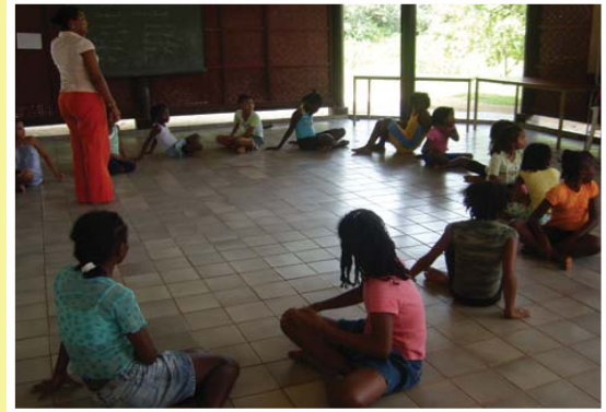
NAKS jongeren tijdens educatiesessie