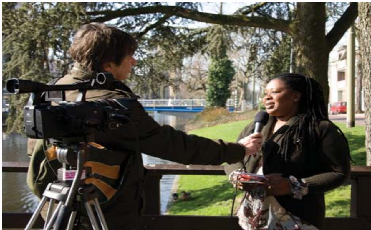
Opname voor Cineac muziek

Het programma Cineac Muziek wordt in de eerste week van april uitgezonden op Cineac TV Rotterdam. De uitzending zal daarna ook te bekijken zijn op het internet en wel op www.cineactv.nl .